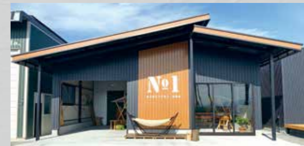
景観条例地区にも対応した切妻風屋根のカッコいいガレージ。 HHD