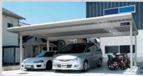
雪にも地震にも強い鉄骨柱仕様カーポート。 キャノポート