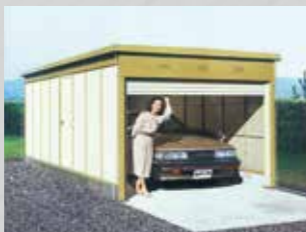
耐久性、軽量スチールシャッター付ガレージの決定版。 サーリー