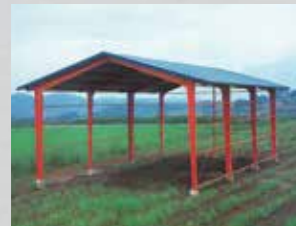
玉ねぎハウスの愛称で親しまれたゼットハウス。丈夫さは実証済みのカクイチ特殊Z型鋼。 ゼットハウス発売

創業当時の銅鉄金物時代から扱ってきた鉄のノウハウを活かし、 カクイチが創り出したのは、これまでにないがっしりしたガレージハウス。 創業当初よりの心得「品質第一」と「お客様第一」はこれからも受け継いでいきます。