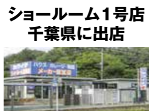
ショールーム1号店 千葉県に出店