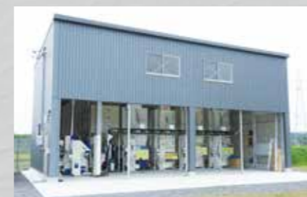
高さ6mの大型倉庫 大型ハウス