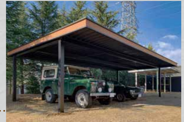
頑丈な鉄骨構造だから、中柱なしの奥行き開口部9m。無骨でタフなカーポート。 B-CANO