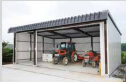
鉄骨+ブレース構造による頑丈な構造と美しい塗装。 広スペースハウス