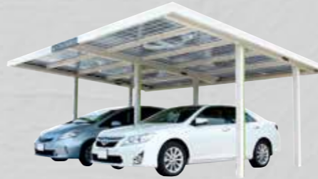
日よけや雨よけ、ガレージとしても使える太陽光パネル一体型の屋根スペースという新発想 e-hizashi