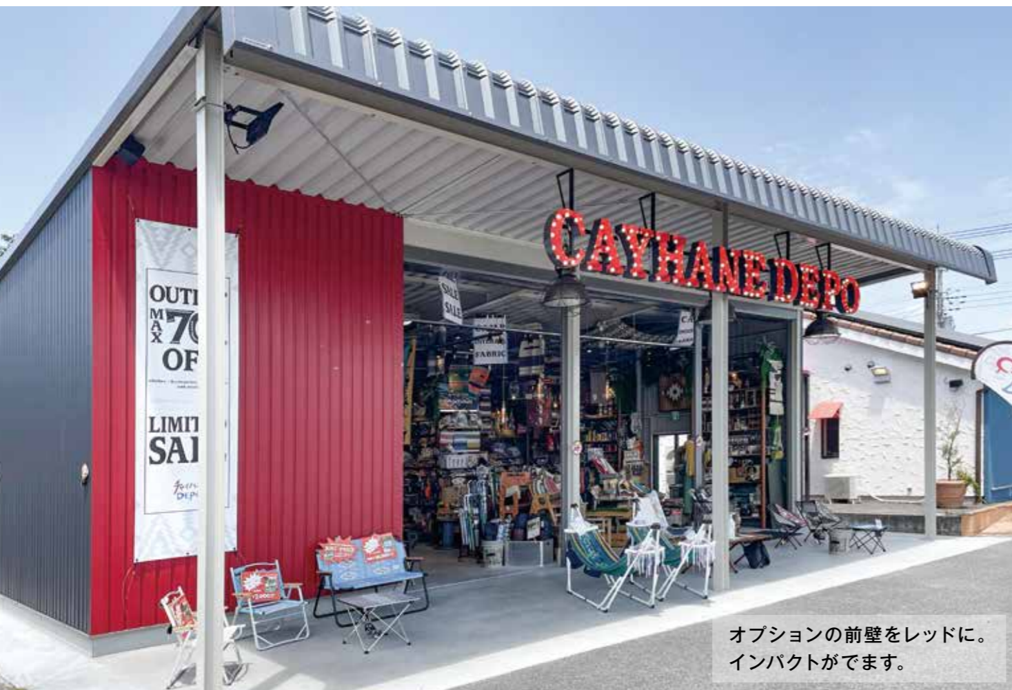
オプションの前壁をレッドに。 インパクトがでます。