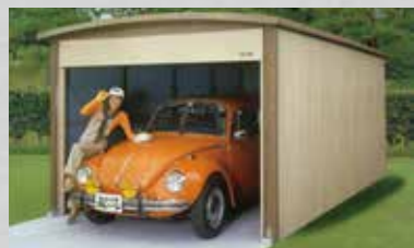
愛車を雨・風・雪・霜・直射日光から完全に護る頑丈ガレージ デラックスガレージ