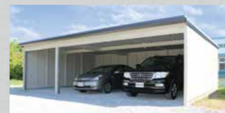
太陽光パネル搭載可能なガレージ。 NEVO G3