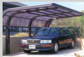
力強さと優雅さを兼ね備えた信頼のカーポート。 かたぎり