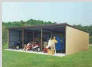
農機具などの格納に便利な間口の広い組立ハウス。 農機具ハウス

1968 1969 1977 1980 1981 1986 1999 2004 2010 2011 2013 2014 2015 2016 2018 2021 2022 2023