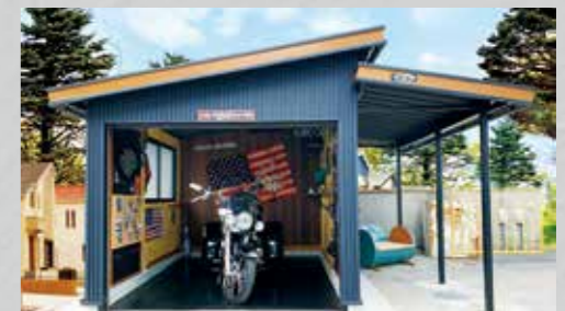
HHDのミニサイズガレージ。大人の秘密基地。 MINI-HHD