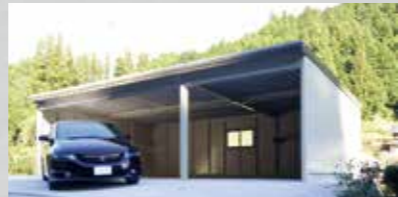
どんな住宅にもマッチするシンプルガレージ グランディオ